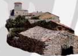
Hornillos del Camino

Su casco antiguo configura uno de los trazados urbanos más largos por los que discurre el Camino de Santiago con casi un kilómetro de longitud.