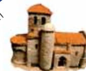
Monasterio de Rodilla

El monasterio, que colonizaría a todo este valle, pudo estar en lo que hoy es la iglesia parroquial de Santa Marina y que ya existía en el S.X. De hecho en la referida iglesia se encuentran vestigios visigóticos, que pudieran pertenecer al mismo.