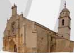
Colegiata de Nuestra Señora del Manzano

Fue dado por Alfonso VII al Monasterio de San Dionisio de París. Con los años se crearon hasta tres hospitales, el de San Lázaro, destinado a leprosos y peregrinos, el del Santo Espíritu, creado para romeros y peregrinos, hoy desaparecidos.