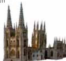
Catedral de Burgos